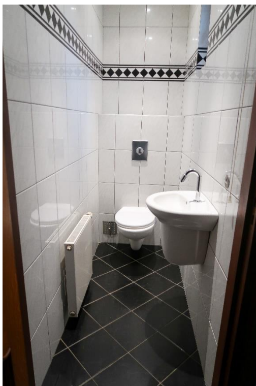
Toilet | Woonkamer