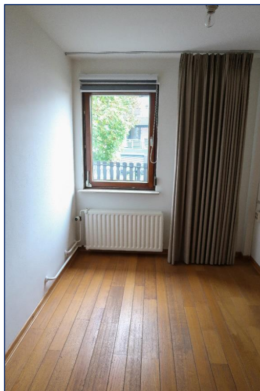
Overloop | Slaapkamer | Badkamer