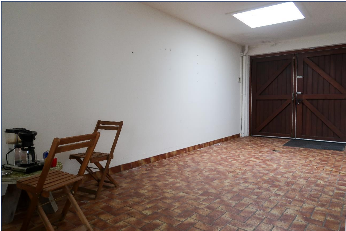
Garage / bijkeuken