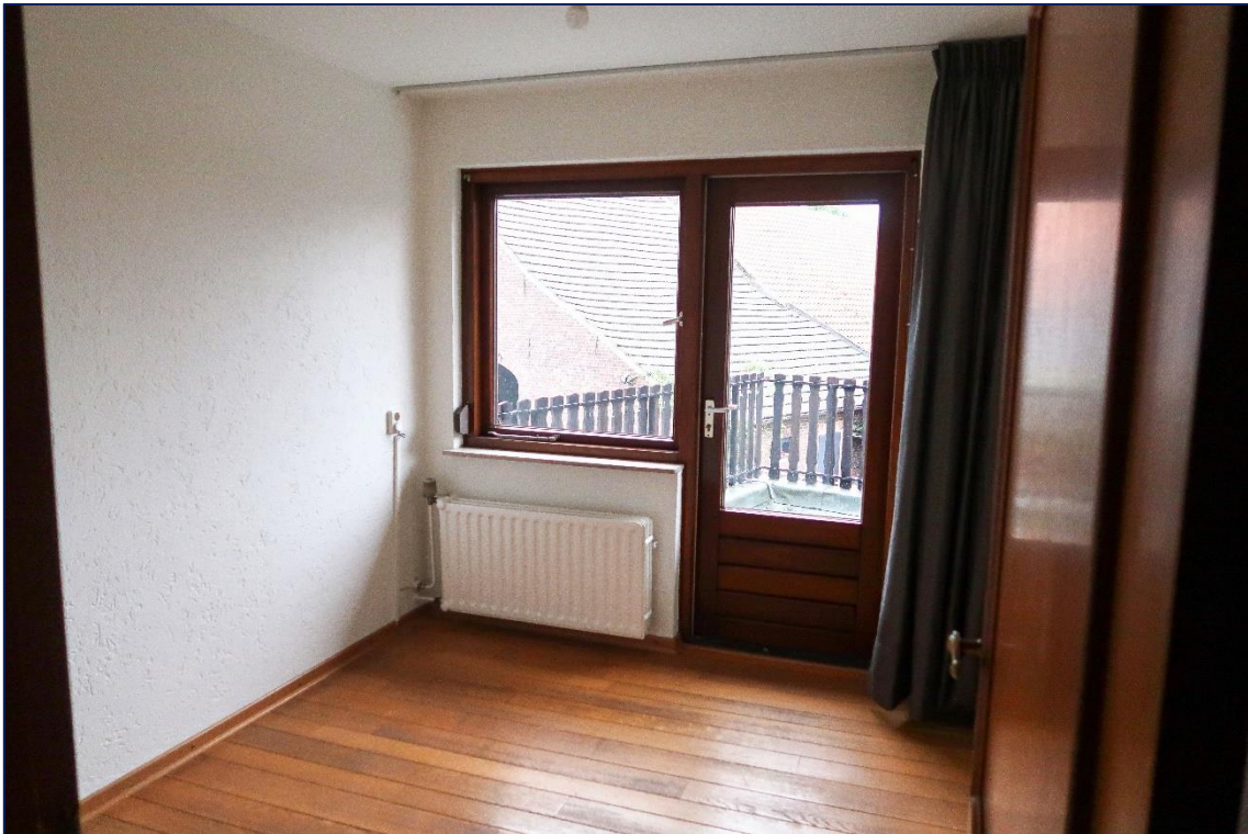
Slaapkamer | Achterzijde