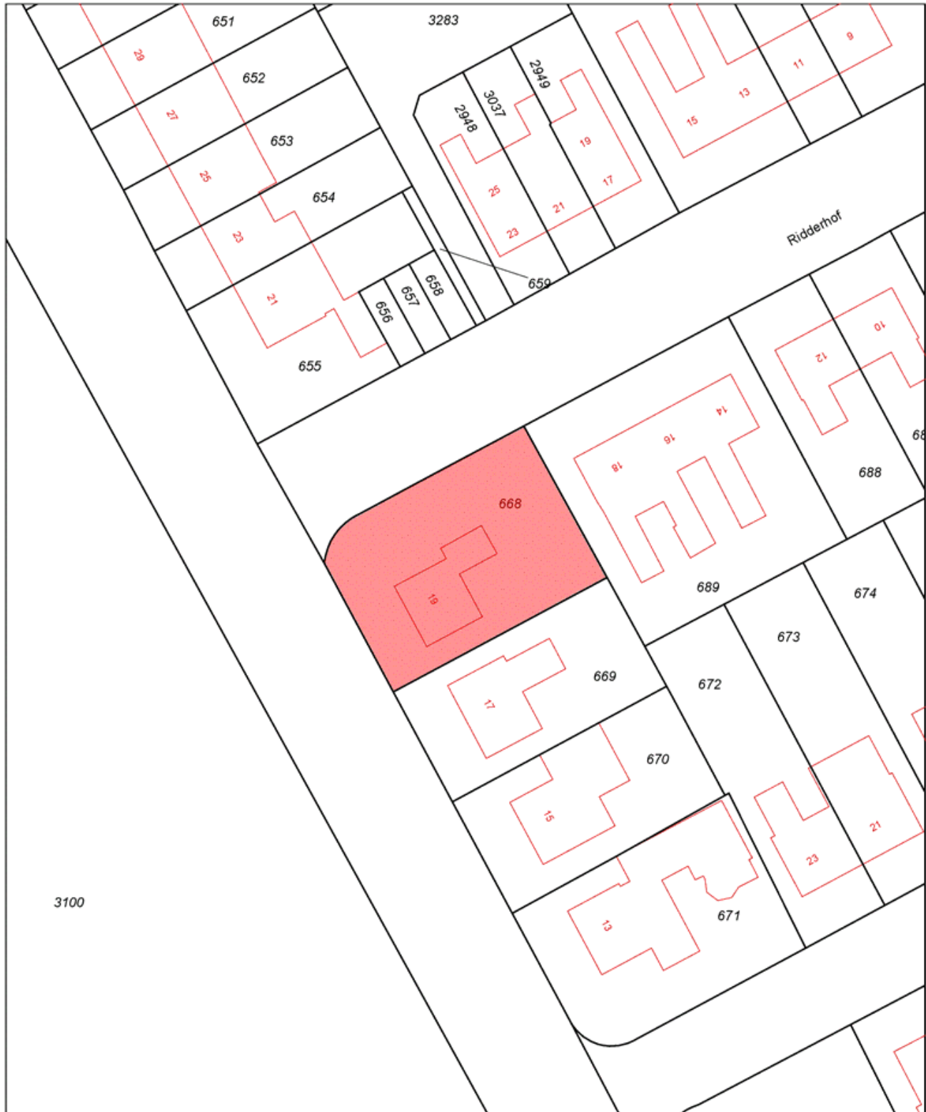
Uittreksel Kadastrale Kaart