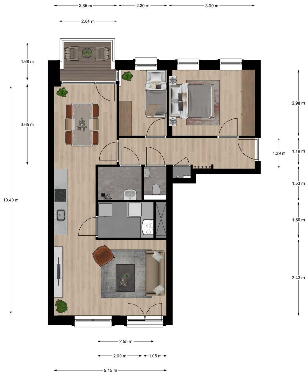
Houttuinen 40-A - Delft