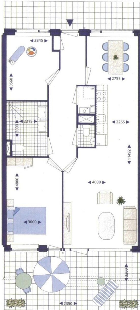
Begane grond, bouwnummers 2* en 3*