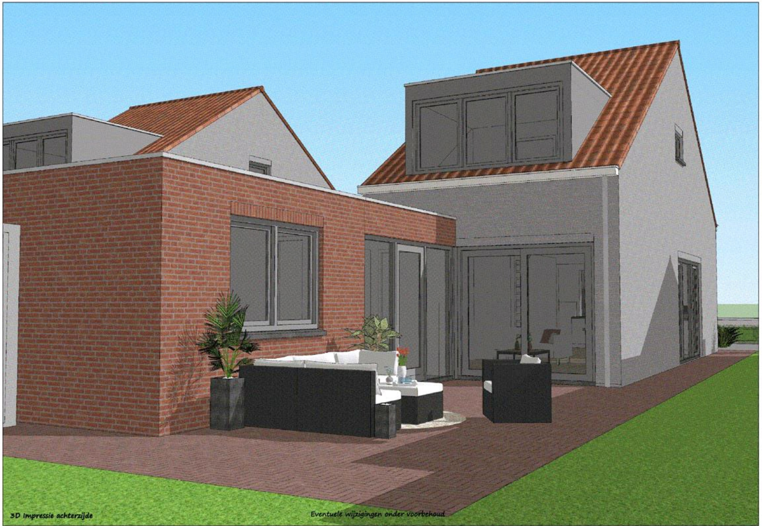
3D impressie achterzijde