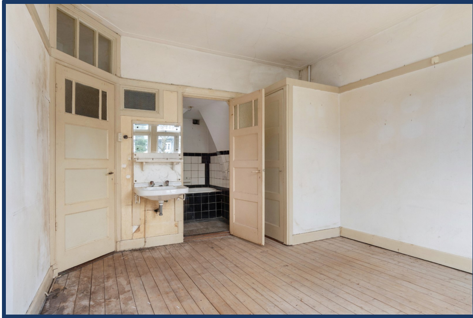
slaapkamer az III