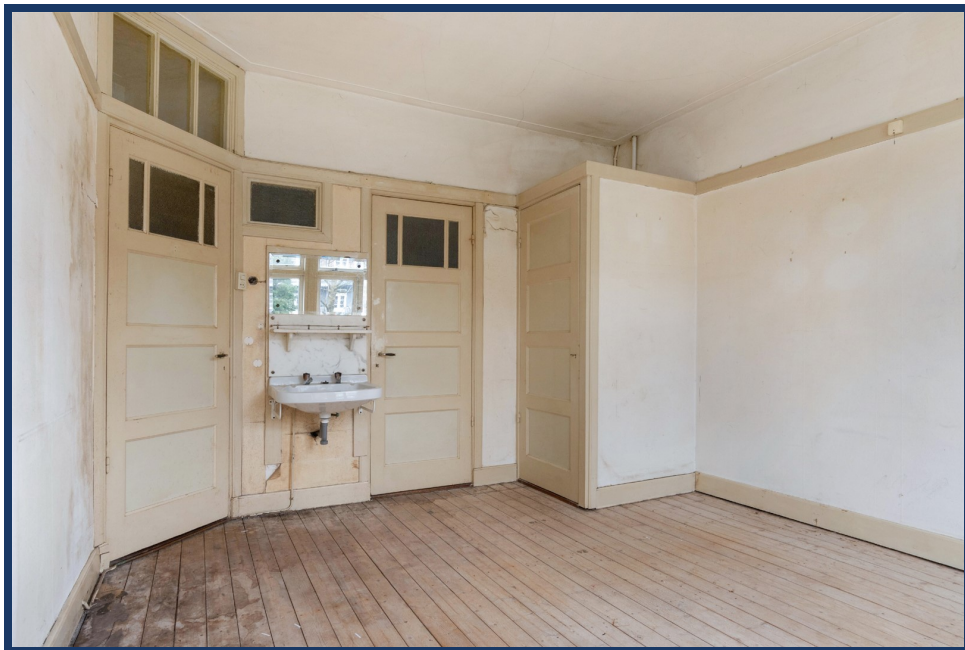
slaapkamer az II

Maasstraat 79, 1078 HE Amsterdam Telefoon: 020-6792020 Fax: 020-6792112 E-mail: info@beekman-makelaardij.nl Internet: https://www.beekman-makelaardij.nl