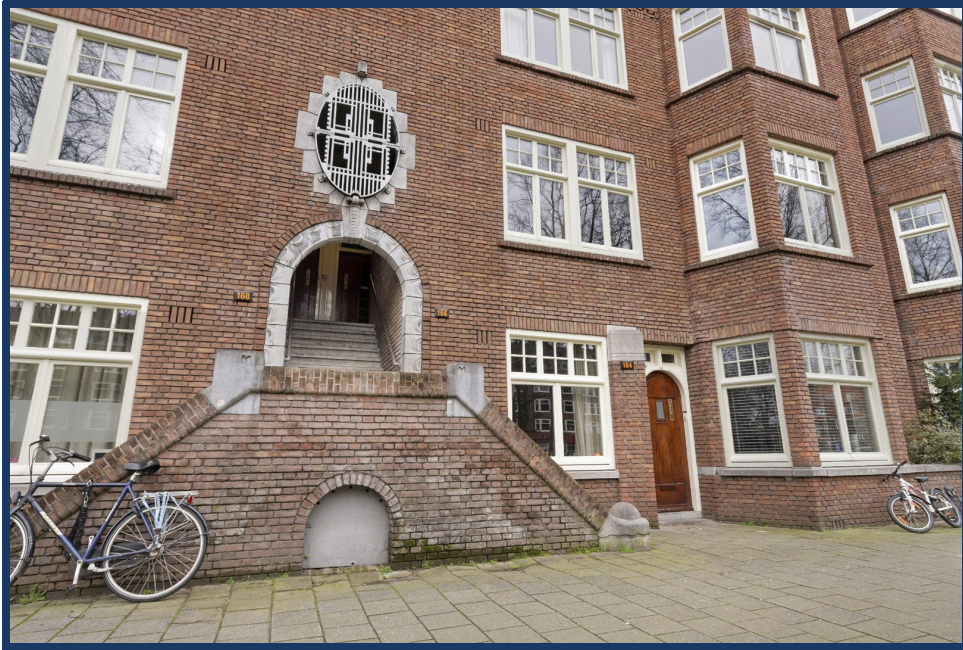
entree va straat