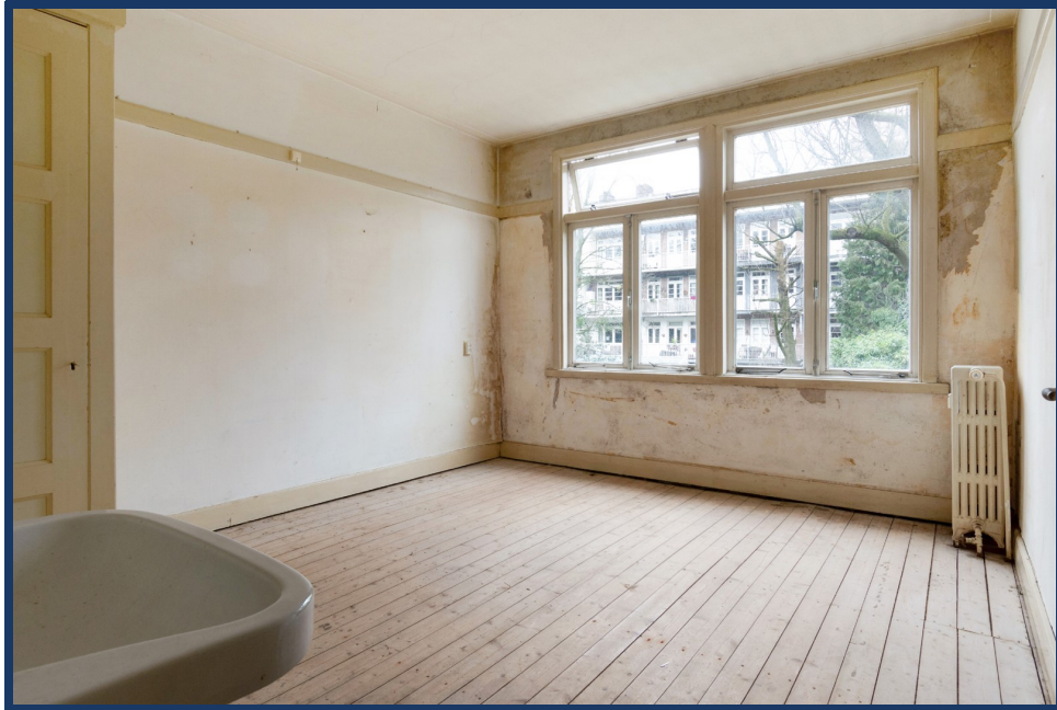
slaapkamer az I