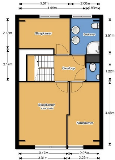
Plattegrond eerste verdieping