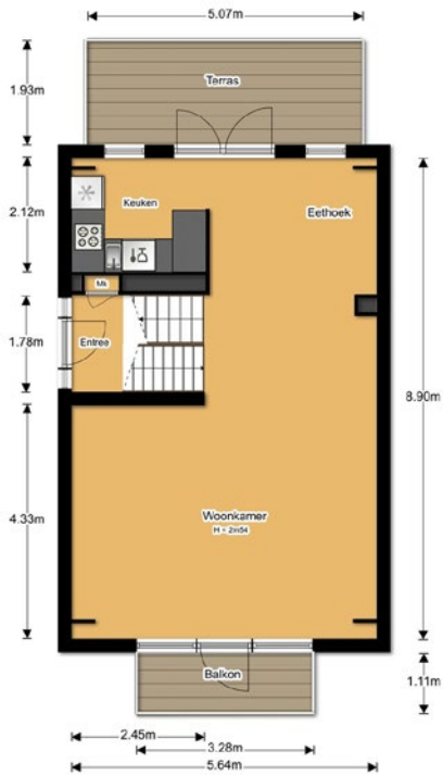
Plattegrond begane grond