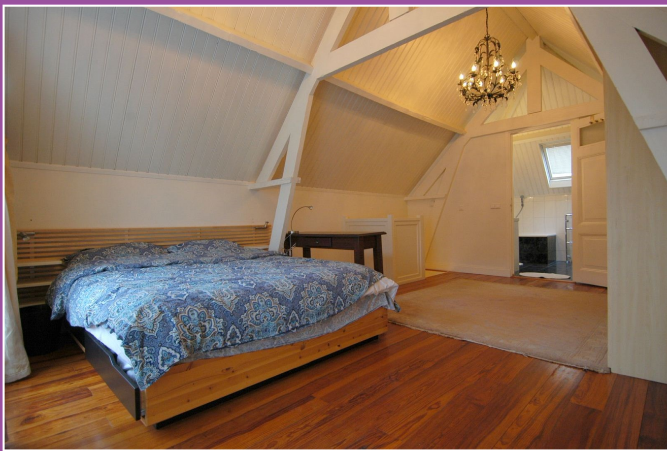
Slaapkamer naar badkamer