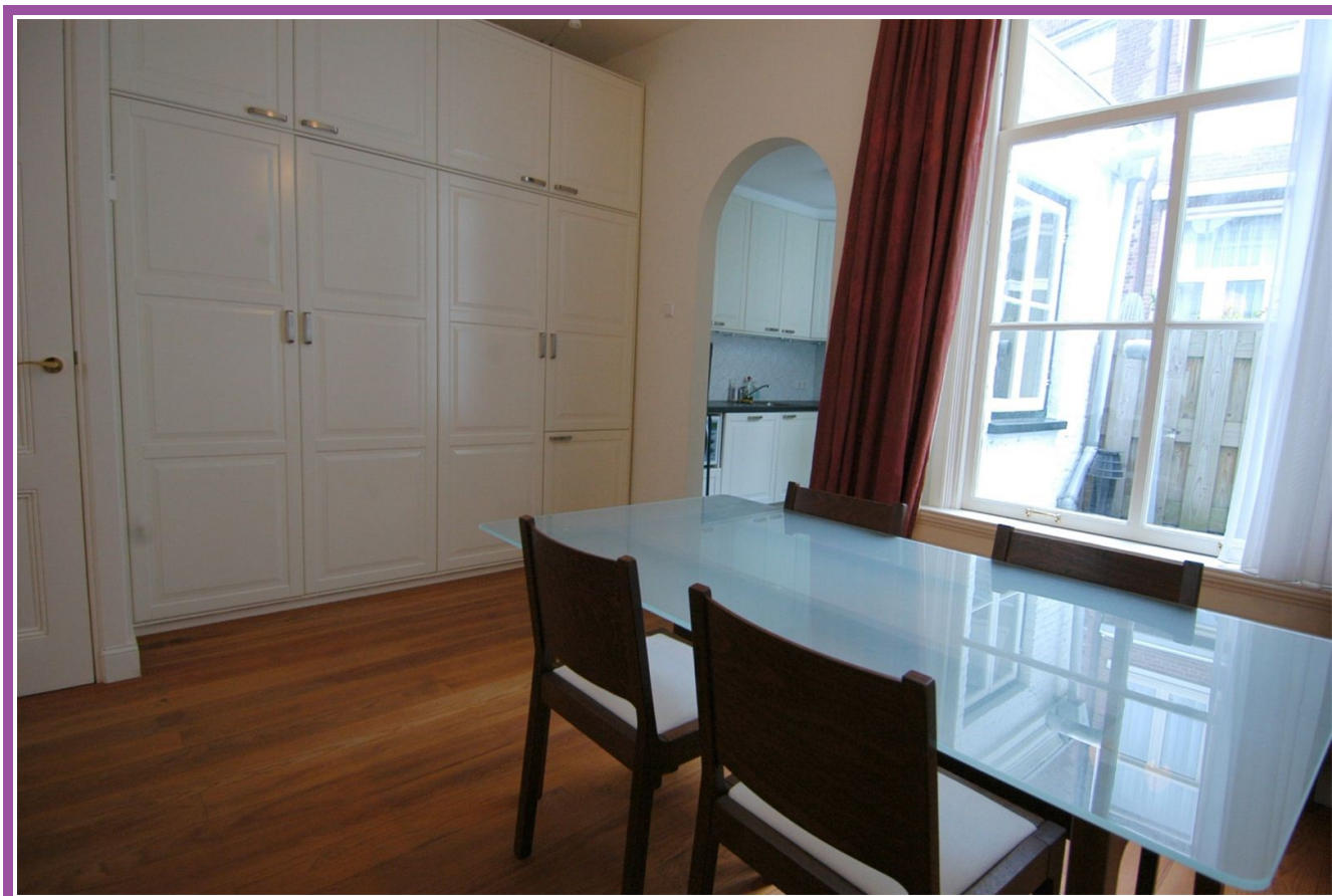
Eetkamer en kasten