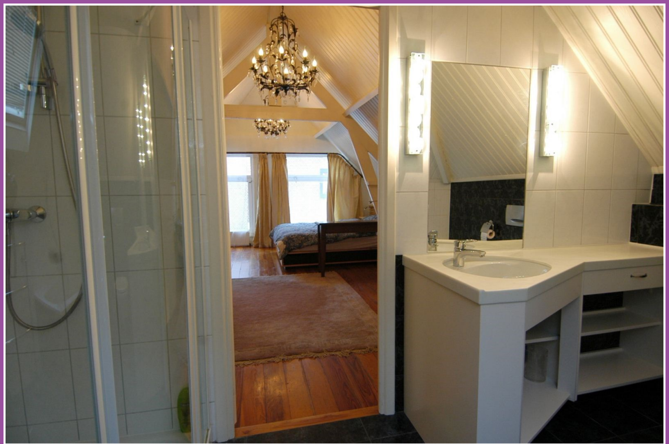
Badkamer naar slaapkamer