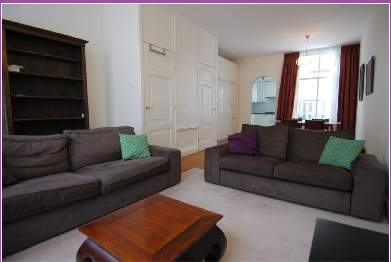
Woonkamer en keuken