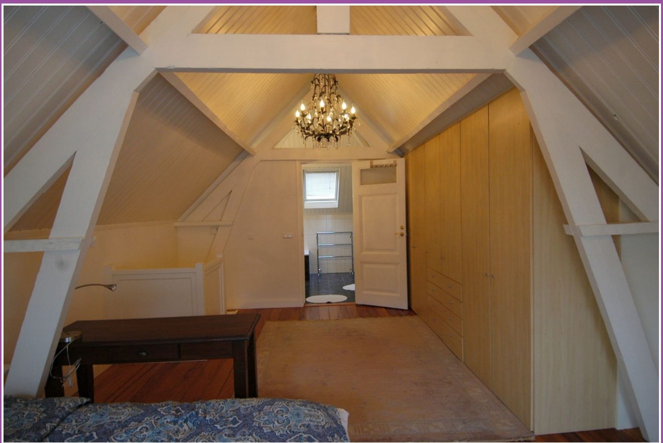
Slaapkamer en kasten