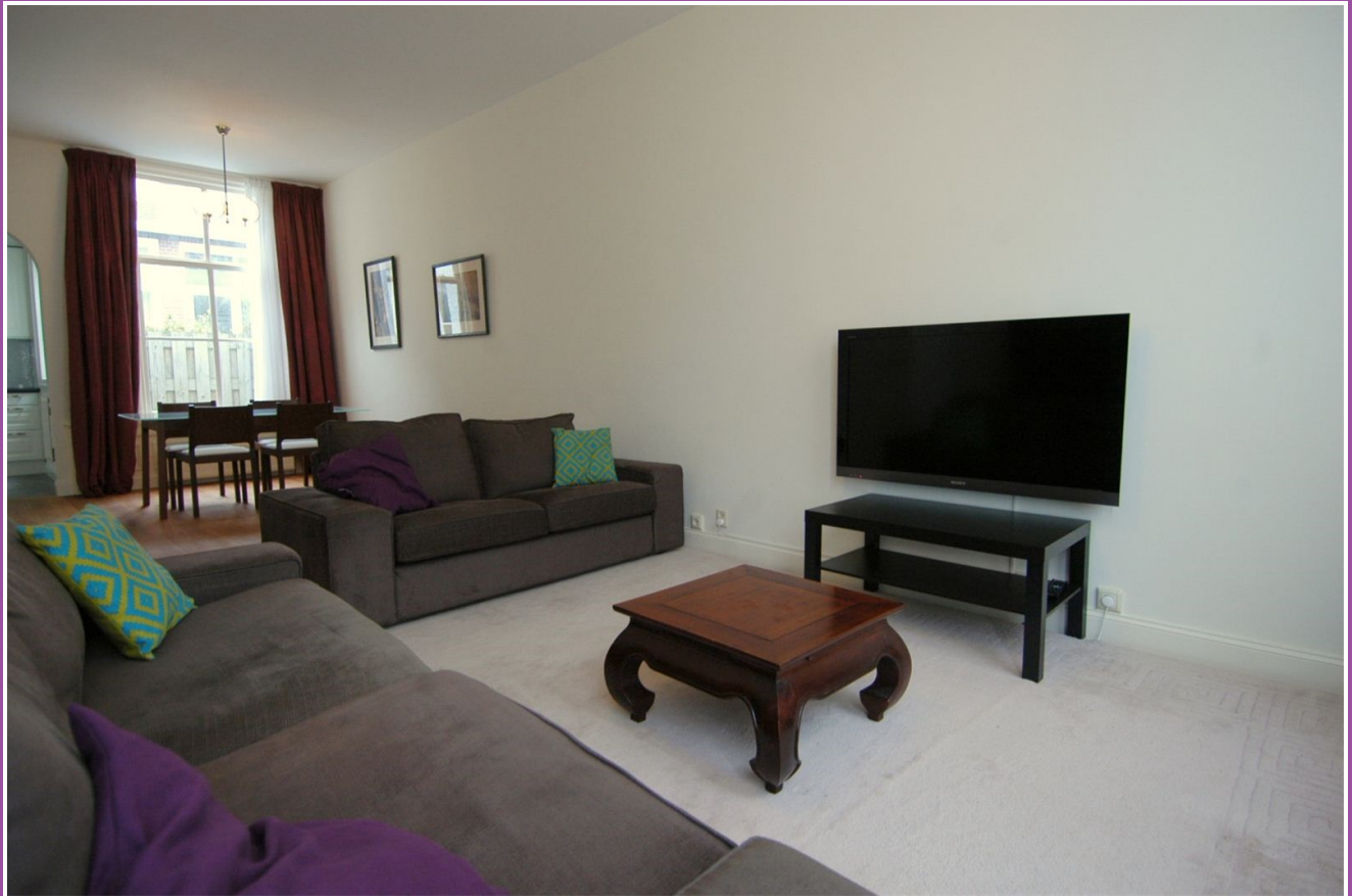
Woonkamer en tv