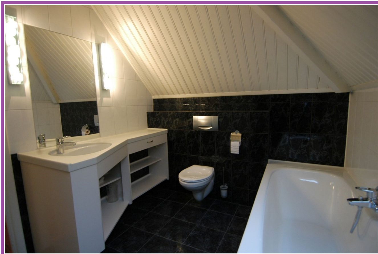
Badkamer en wastafelmeubel